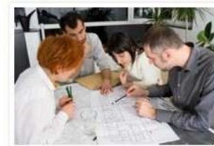
Project managers need a broad range of skills.

As the complexity of your projects increases, the number of details you have to monitor also increases. However, the fundamentals of managing a project from start to finish are usually very similar.