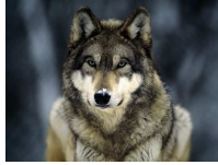
Vilks Canis lupus