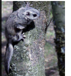
Lidvāvere Pteromys volans