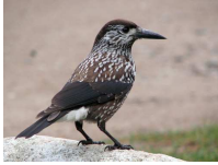
Riekstrozis Nucifraga caryocatactes