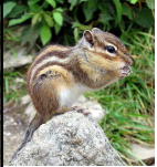
Burunduks Tamias sibiricus