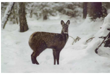
Kabarga Moschus moschiferus