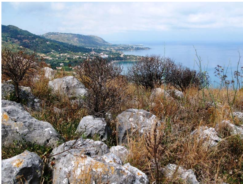
Pēc konferences palika spēcīgi iespaidi par Sicīlijas brīnišķo un arī skarbo dabu.....

Teksta un fotoattēlu autors Ivars Druvietis