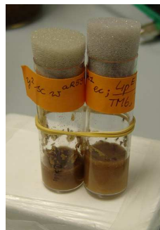
2. attēls. Augļu mušiņu audzēšana barotnē.