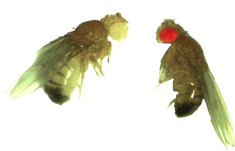
1. attēls. Sarkanacaina un baltacaina augļu mušiņa.

54. uzdevums. Skolēni eksperimentā sakrustoja augļu mušiņas. Mātītei bija brūns ķermenis un balta acu krāsa, bet tēviņam bija brūns ķermenis un spilgti sarkana acu krāsa (1. attēls). Krustošanu un audzēšanu veica mēģenē (2. attēls). Acu krāsu noteica izpētot augļu mušiņas stereomikroskopā. F 1 paaudzē ieguva 120 pēcnācējus. 91 augļu mušiņai bija sarkana acu krāsa, bet 29 augļu mušiņām bija balta acu krāsa.